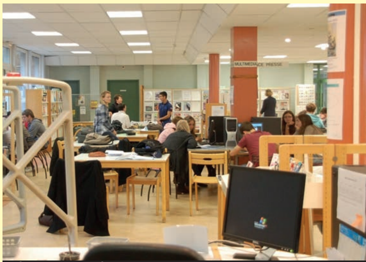
Le CDI de l'Institut de Genech : un espace pour apprendre, se documenter, s'enrichir...