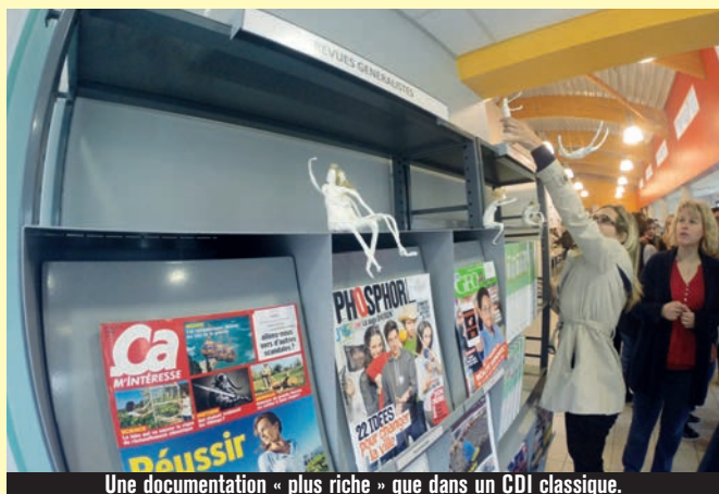
Une documentation « plus riche » que dans un CDI classique.

rences nous font découvrir des sujets auxquels nous ne nous serions pas spontanément intéressés. Elles nous donnent en outre la possibilité de travailler avec des associations qui peuvent nous proposer des stages ou nous ouvrir les portes de structures sociales avec lesquelles elles sont en relation », apprécie Julie, une élève particulièrement mobilisée, dont le passage derrière la caméra a contribué à améliorer la confiance.