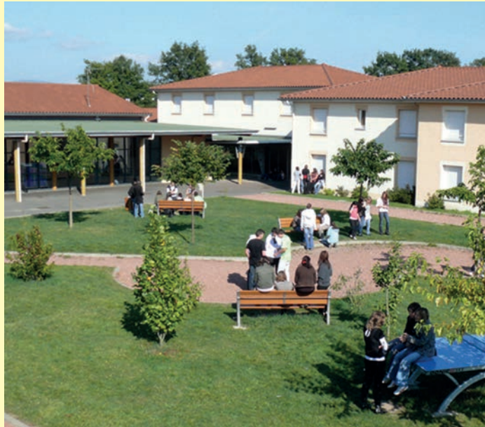
Le LTP Le Puits de l'Aune et son agorathèque.